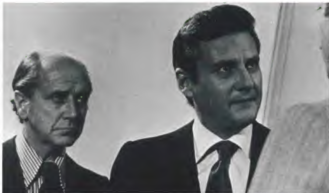
Manuel Alexandre - Carlos Larrañaga